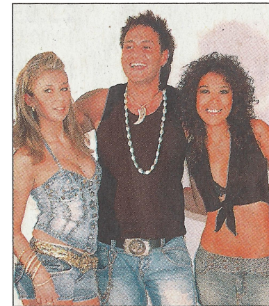
Spaß bei der Arbeit.